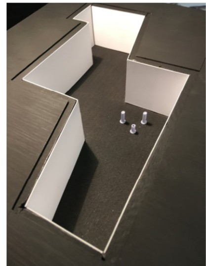
K 3 – Die Halle mit dem Knick - Blick in den Innenraum und von oben (ohne Deckel)